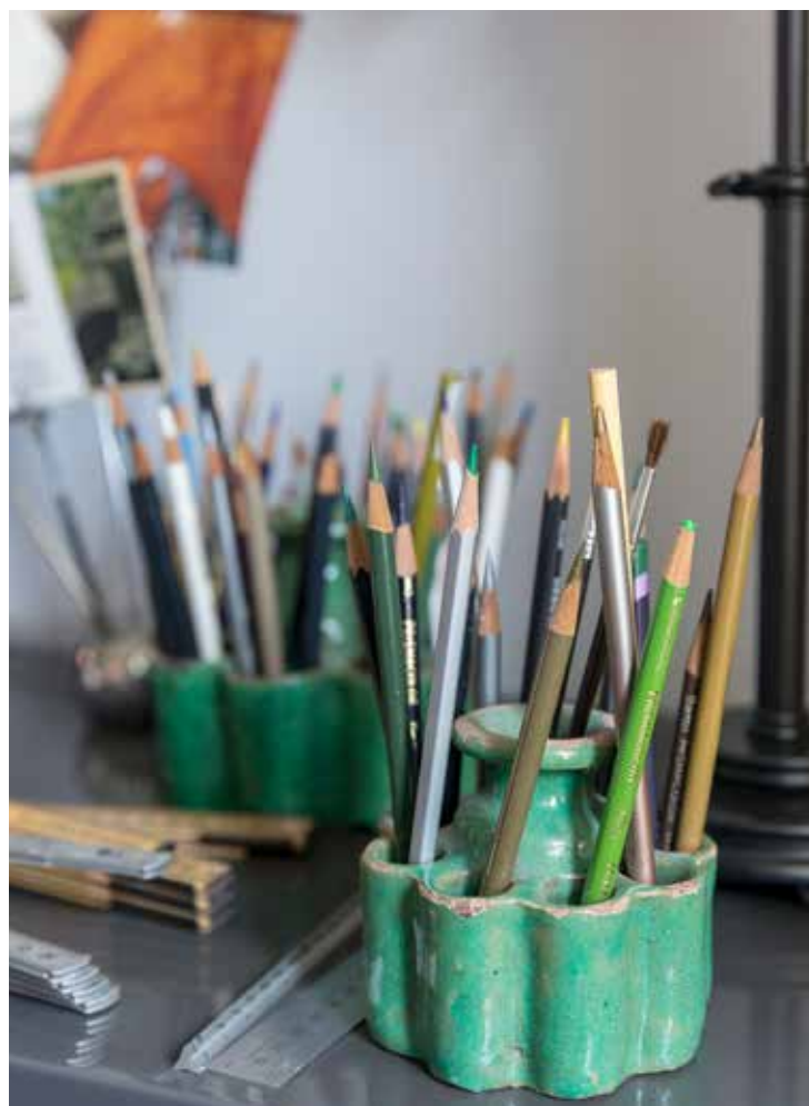
Ovan t v: "Som ny i landet har jag mycket att upptäcka, både i min egen trädgård och på fälten som omger den. Liksom trädgårdens växtlighet är även det omgivande landskapet föränderligt och växlande med blommande raps, grönskande fält med sockerbetor och böljande kornfält." Ovan t h: På skrivbordet förvaras skisspennorna i patinerade penselställ köpta på en basar i Fez, Marocko.

»Här på den skånska landsbygden är det helt nödvändigt att plantera i lager och nivåer för att försvara sig mot klimatet«