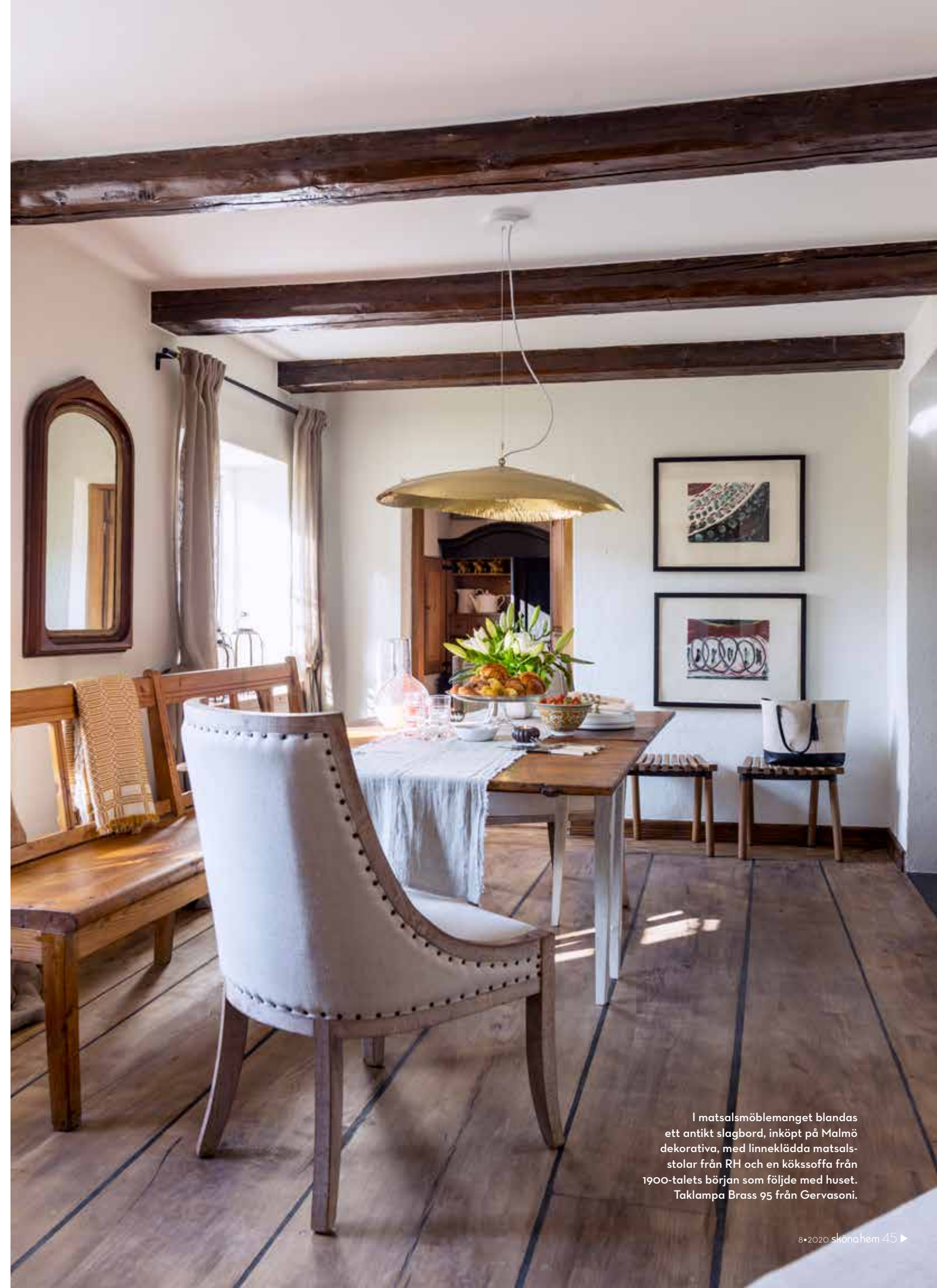
I matsalsmöblemanget blandas ett antikt slagbord, inköpt på Malmö dekorativa, med linneklädda matsalsstolar från RH och en kökssoffa från 1900-talets början som följde med huset. Taklampa Brass 95 från Gervasoni.