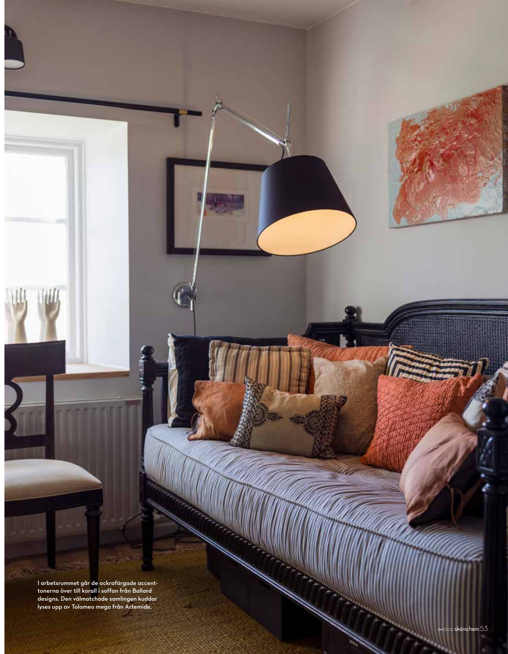
I arbetsrummet går de ockrafärgade accenttonerna över till korall i soffan från Ballard designs. Den välmatchade samlingen kuddar lysas upp av Tolomeo mega från Artemide.

- Jag känner mig hemma här och ser fram emot att lära mig det svenska språket, utforska naturen, kulturen och landet. En del av mig älskar stadslivet och jag är glad att jag lätt kan ta mig till storstäder runt om i Europa och fortfarande får mina doser av San Francisco. Men att dagligen få vakna till soluppgången här, släppa ut hundarna, kasta boll med dem i trädgården och dricka mitt kaffe i morgonsolen - det är oslagbart. ■